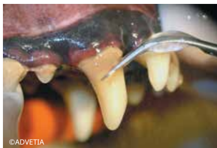
Detartrasi sottogengivale con la punta N. 1S