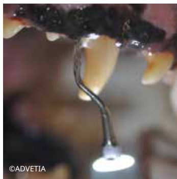
Debridement sottogengivale con un inserto PV1 inserito nella tasca parodontale