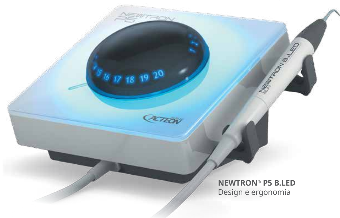
NEWTRON® P5 B.LED Design e ergonomia