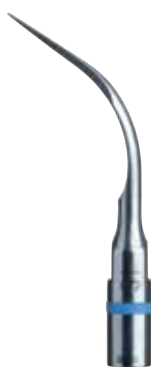
1S Detartrasi sottogengivale • Adatta agli spazi interprossimali e alle tasche piccole