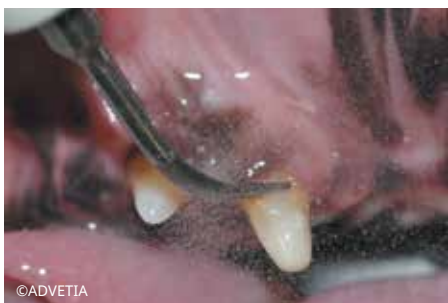
Detartrasi sopragengivale con la punta N. 1